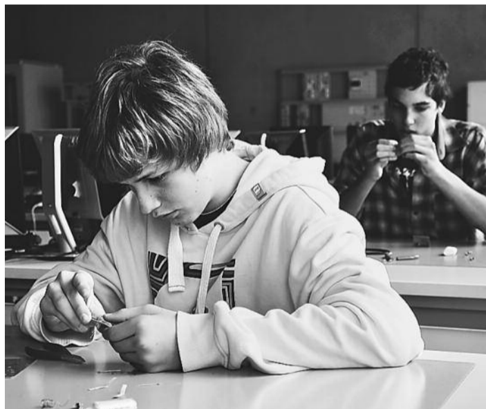
Schnuppernachmittag: Dreissig Jugendliche konnten praktische Arbeit erleben.