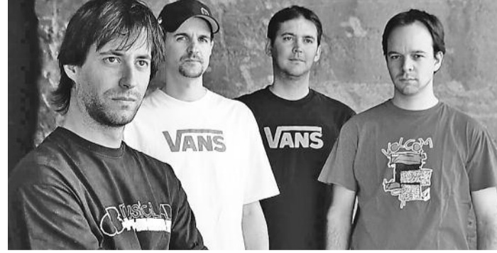
Happy Birthday! Seit 18 Jahren sind allpot futsch im Geschäft.